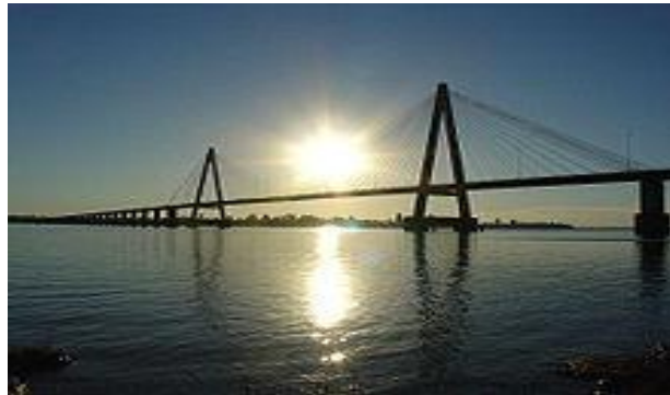
El conocido puente Internacional, que une a Encarnación con Posadas, Argentina.

Se puede acceder al Departamento de Itapúa por vía terrestre a través de las siguientes rutas: