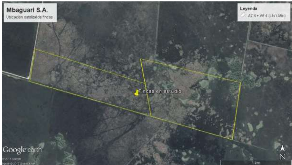
Figura 2: Croquis de ubicación y acceso.

Las propiedades en estudio se encuentran ubicadas en el Distrito de Santiago, Departamento de Misiones.